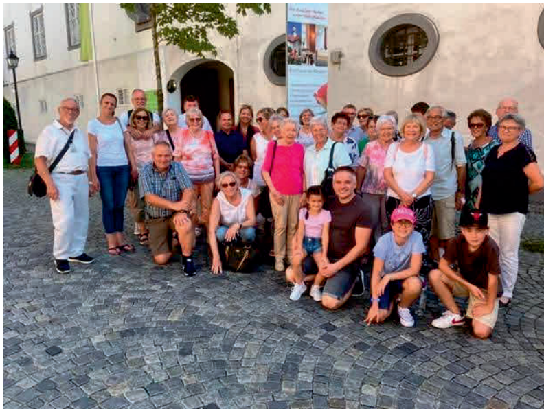
Pfarreiausflug nach Bad Wörishofen