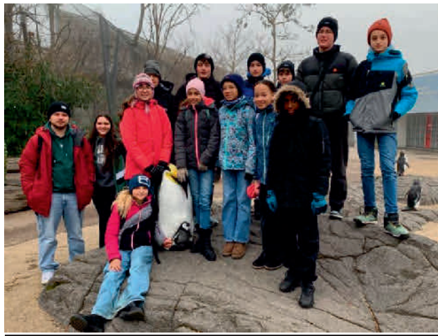
Miniteam im Züri Zoo